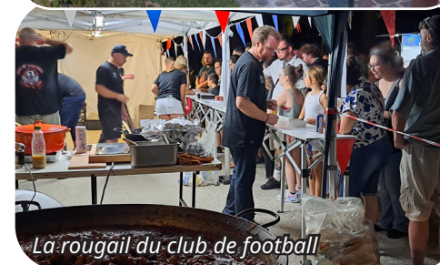
Le rougail du club de football