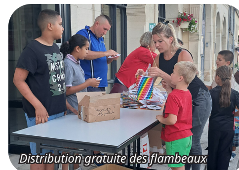
Distribution gratuite des flambeaux

Un grand merci à toutes les personnes mobilisées pour l'organisation de cette belle soirée, et notamment aux bénévoles du club de football et aux services municipaux.