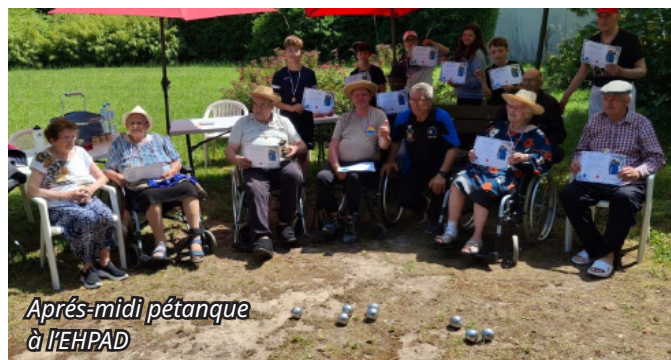
Après-midi pétanque à l'EHPAD

Enfin, le 11 juin, une partie intergénérationnelle a été organisée à l'EHPAD, réunissant jeunes et résidents autour du cochonnet. Un bel exemple de lien entre les générations grâce au sport local.