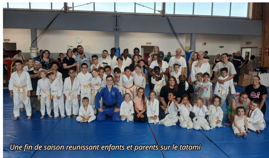
Une fin de saison réunissant enfants et parents sur le tatami