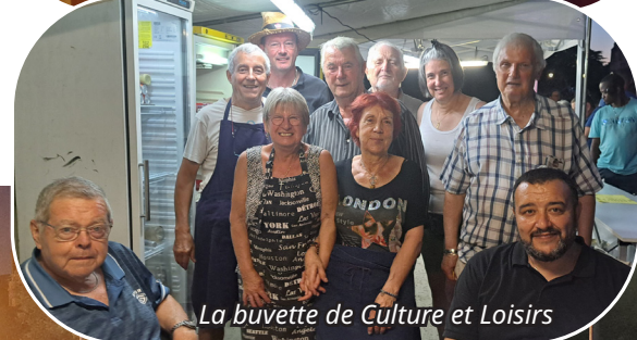
La buvette de Culture et Loisirs