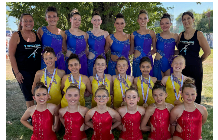
*Fédération Française Sportive de Twirling Bâton **Fédération Sportive et Culturelle de FranceD