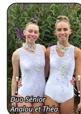
Duo Sénior Analou et Théa

Le club termine 1 er des Hauts-de-France et 8 ème meilleur club national sur 58 !