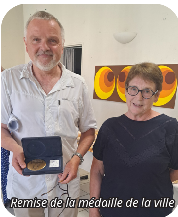
Remise de la médaille de la ville

Un grand merci à eux trois pour ces belles années au service de nos enfants. Nous leur souhaitons une retraite heureuse et bien méritée !