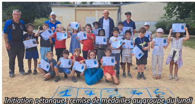
Initiation pétanque : remise de médailles au groupe du lundi

Quand la pétanque s'invite chez les jeunes et les aînés.